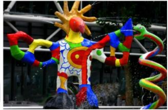
La fontaine Igor, Paris (à côté du centre Pompidou, Beaubourg)

Elle a souvent installé ses œuvres en extérieur pour qu'elles soient accessibles au plus grand nombre comme à Paris dans la fontaine de Stravinsky (page 3 du diaporama).