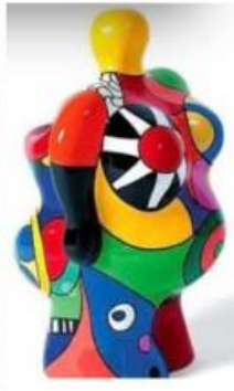
Nanas (1960 – 1970)