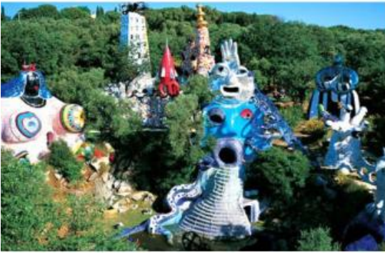
Le jardin de Tarot, Italie, 1979 Prolongement : Gaudi, Le parc Guëll en Espagne