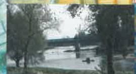
Vue du pont