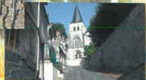
Eglise de Pouilly